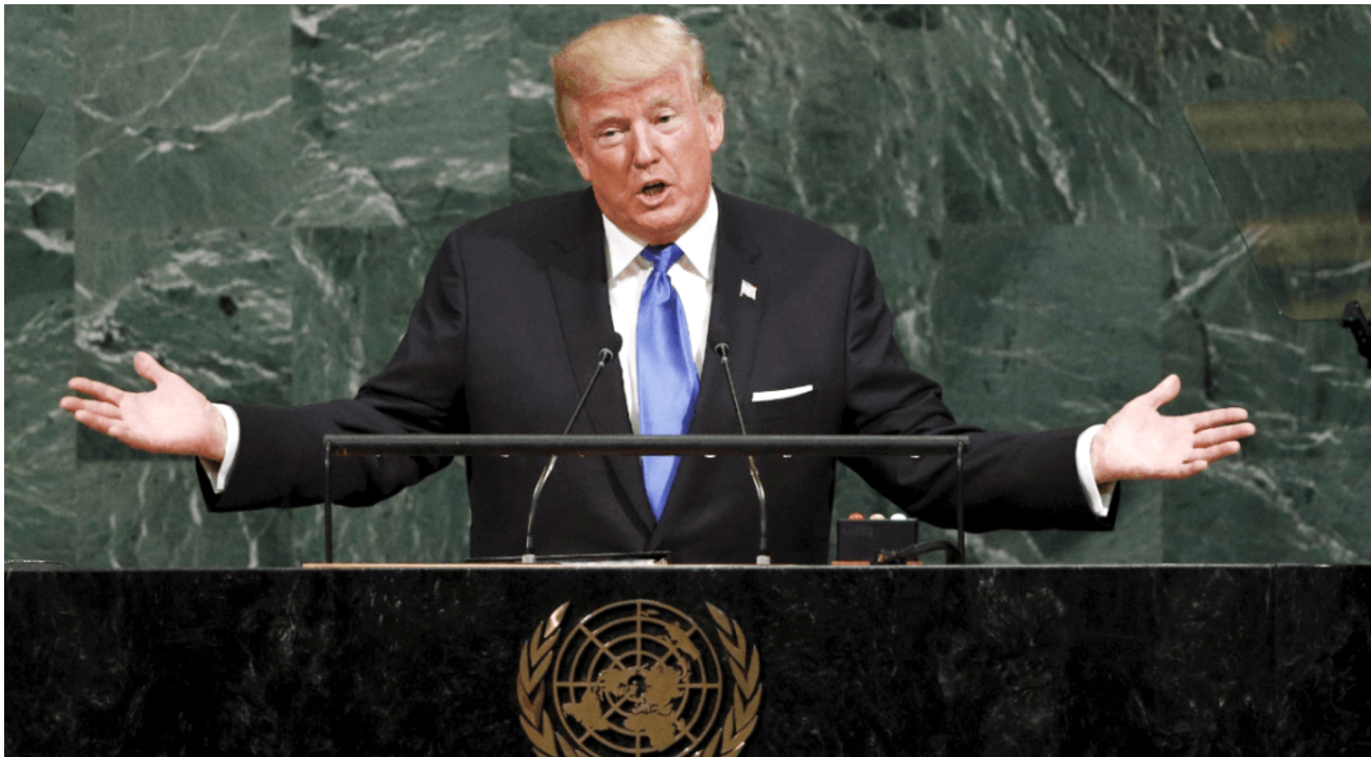
Trump limitó a 50,000 el número de refugiados que pueden entrar anualmente en EEUU.