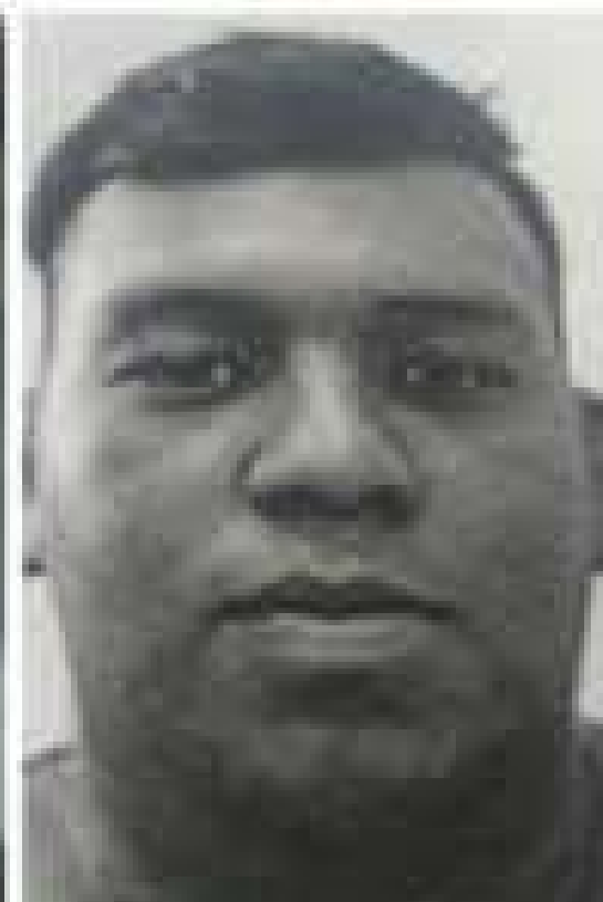
Dos de los tres jóvenes muertos en la colonia Rosa Linda de Tegucigalpa, eran hermanos.