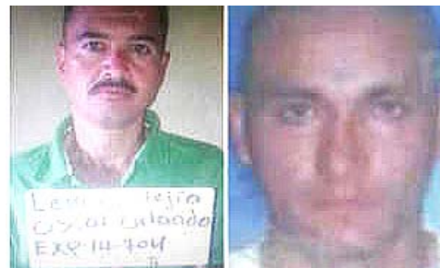
Fotos de los reclusos que escaparon en Ocotepeque.