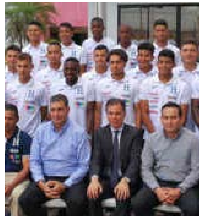
La selección de fútbol Sub-17 de Honduras realizará una gira por España. Aquí posando con el presidente de la FENAFUTH.

El mundial empezará el seis de octubre hasta el 28 de ese mismo mes y está conformada por 24 selecciones repartidas en seis grupos.