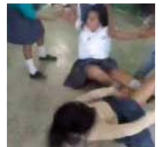
Estudiantes cuando la pelea estaba en su momento mas caliente.

Hasta los momentos no se ha especificado el motivo por el cual las dos señoritas ofrecieron el espectáculo. No obstan-