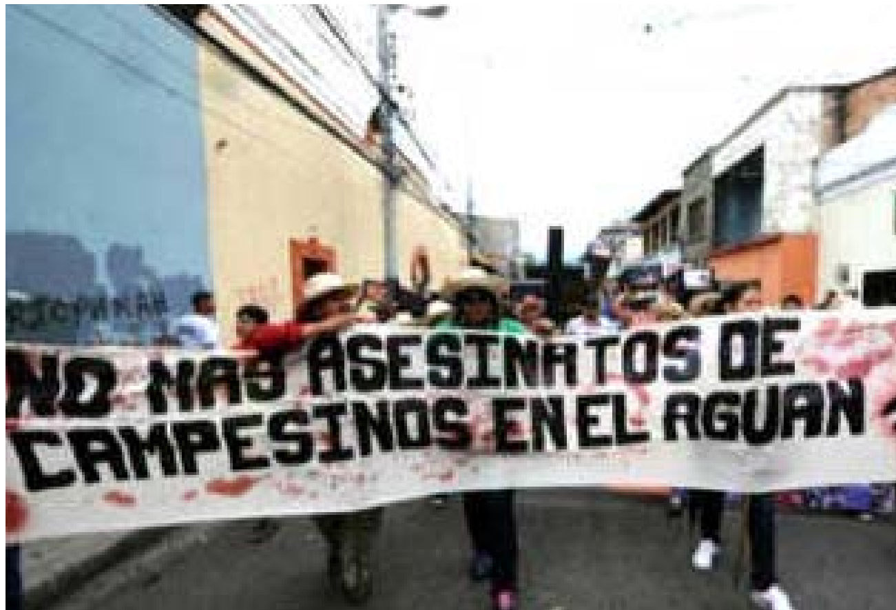
Los pobladores del Bajo Aguán han estado reclamando el esclarecimiento de varios asesinatos de campesinos en aquella zona.

Las cosas no salieron como lo pensaron y los individuos huyeron. Sin embargo, se desconoce si les dieron captura posteriormente.