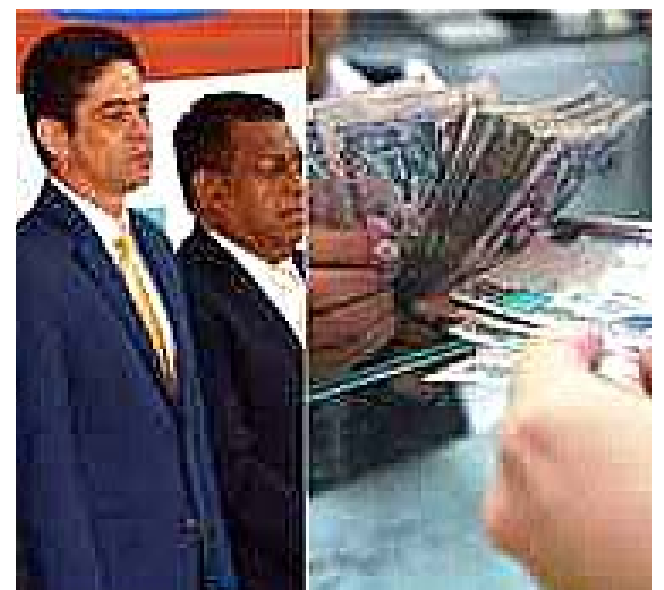
El TSE recibió el desembolso para pagar la Deuda Política.

La deuda política es la contribución otorgada por el Estado a los partidos políticos para el financiamiento del proceso electoral. Esta misma, se calcula con base al valor actual del voto que es de 39.39 lempiras multiplicado por la cantidad de sufragios válidos obtenidos por cada fuerza durante las votaciones generales del 2013.