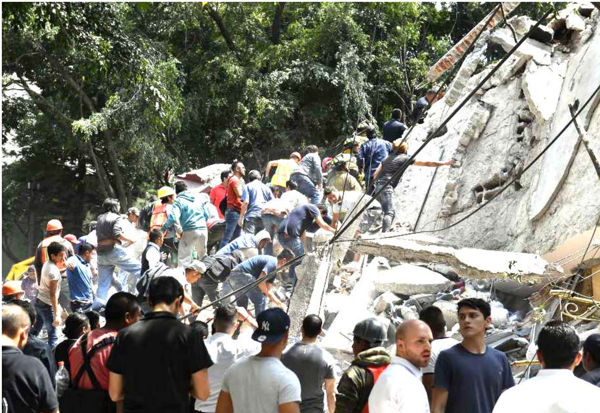
En la CDMX se colapsaron al menos 20 edificios.