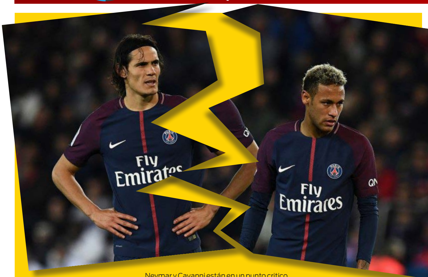
Neymar y Cavani están en un punto crítico.