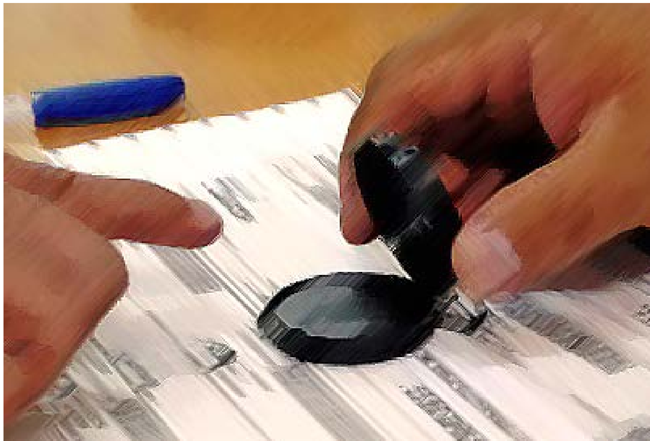
En el caso de las actualizaciones domiciliarias, se realizaron más de 250 mil solicitudes de estos trámites.

electoral empleado en las pasadas elecciones del 12 de marzo de este año tenía un total de 5,795,264 electores.