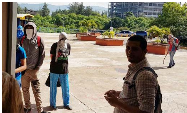
Simpatizantes del MEU siguen con las tomas en la Alma Máter.

“Me imagino que los estudiantes del MEU empie-