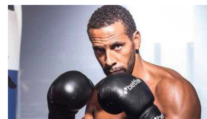
El ex futbolista inglés Rio Ferdinand pasará a usar guantes.

Según informó The Guardian, el ex defensor de Los Diablos Rojos decidió competir profesionalmente en el pugilismo, deporte que adoptó para mantenerse en forma tras su retiro del fútbol y para canalizar su pena tras la muerte de su esposa.